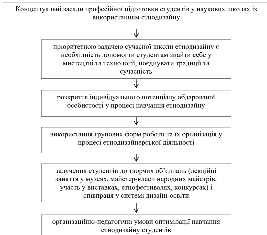
Рис. 1. Концептуальні засади професійної підготовки студентів у наукових школах із використанням етнодизайну

формування категоріально-понятійного апарату, що описує взаємодію суб'єкта й об'єкта художнього проектування, передбачає розвиток навчальної та творчої діяльності студентів від нижчих форм (оволодіння системою знань й умінь із розв'язання художньо-проектних завдань репродуктивного характеру) до вищих (уміння застосовувати набуті знання за нових умов при здійсненні комплексного художнього проектування) (Руденченко, 2017: 18–19).