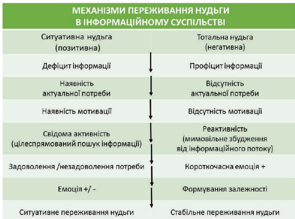
Рис. 2. Розуміння механізмів переживання нудьги в інформаційному суспільстві

Спираючись на ці та наведені вище факти, ми пропонуємо таке розуміння механізмів переживання нудьги в інформаційному суспільстві (рис. 2).