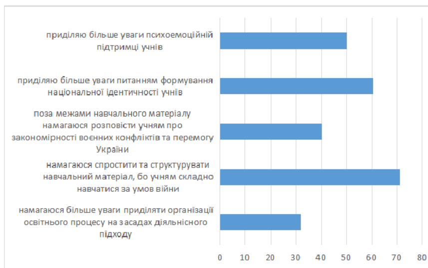
Рис. 3. Зміни в педагогічній практиці вчителів після широкомасштабного вторгнення

Проведене наукове дослідження є одним із перших у царині заданої проблематики. У той же час окреслена авторами проблема не вичерпується означеною публікацією та має перспективність подальших досліджень,