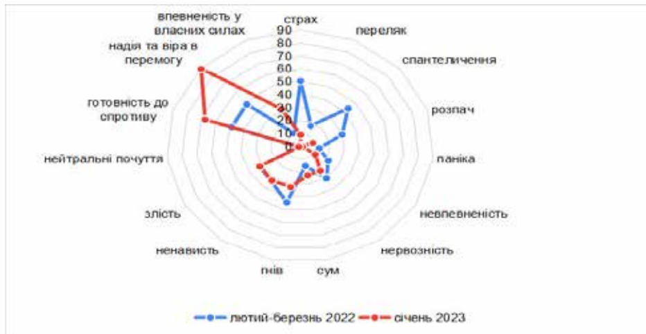
Рис. 1. Діаграма змін емоцій і почуттів учителів протягом 2022 р.

Найбільш складними в емоційному плані для вчителів суспільних дисциплін виявилися лютий-квітень, вересень-жовтень, грудень 2022 р. та січень 2023. Відзначається хвилюючий характер змін рівня гостроти психоемоційних переживань (Рисунок 2).