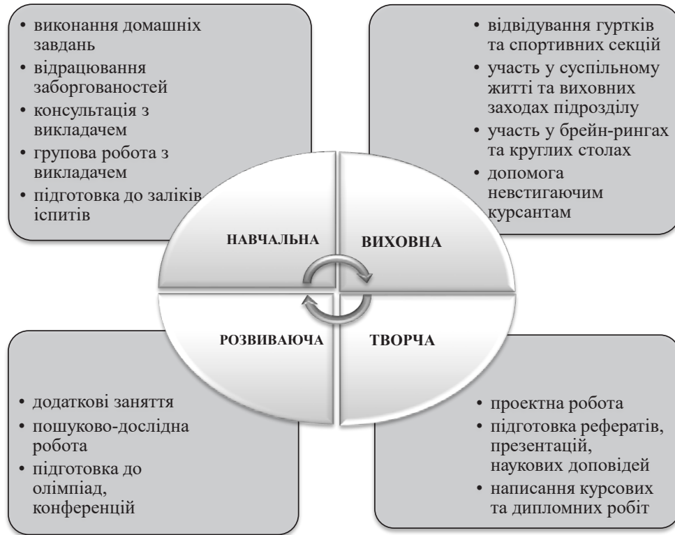
Рис. 2. Завдання, що виконують курсанти в години самостійної підготовки

Зміст та характер завдань, що виконують курсанти в години самостійної підготовки (рис. 2), визначають вид діяльності в цей часовий період: навчальна, виховна, розвиваюча, пошуково-дослідна, творча).