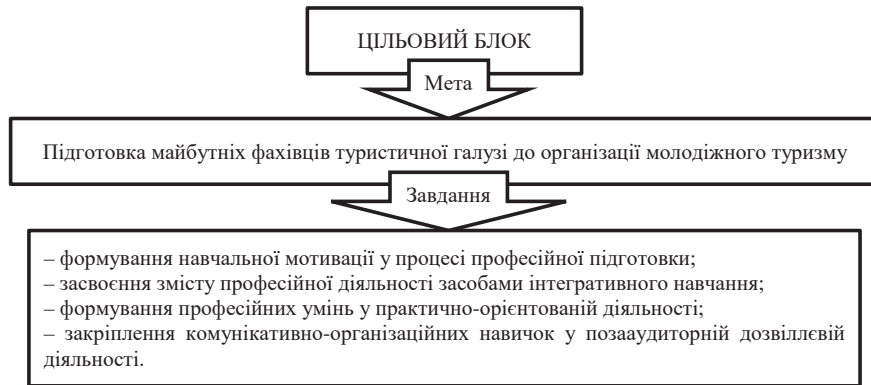
Рис. 1. Цільовий блок структурної моделі, розроблений автором

Для реалізації наступного блоку – організаційного , нами були окреслені підходи, принципи та компоненти, що реалізовувалися через організаційно-педагогічні умови.