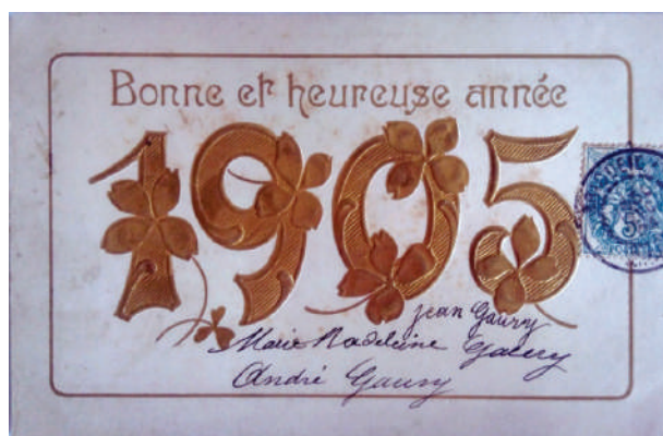
Рис. 6. Новорічна вітальна листівка 1905 року