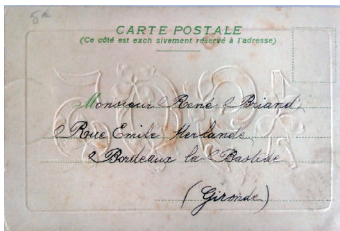
Рис. 12. Адресна сторона новорічної листівки 1905 року (Листівки з приватної колекції колекціонера П.В. Яковенка)

побудови зображення ілюстративної сторони, способу оформлення адресного (зворотного) боків. Характерною ознакою оформлення адресного боку можна назвати наявність розділової смуги, виокремлення місця для марки, мови написів, способу оформлення видавничих знаків, призначення, а також кольорового забарвлення (рис. 12, 13, 14, 15, 16).