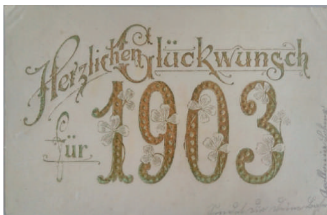
Рис. 8. Новорічна вітальна листівка 1903 року (Листівки з приватної колекції колекціонера П.В. Яковенка)