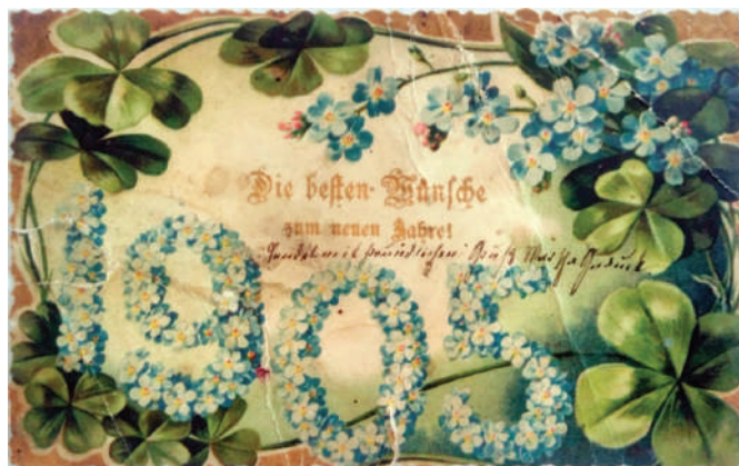
Рис. 4. Новорічна вітальна листівка 1905 року

Наступними розглянемо вітальні листівки (рис. 4, 5).