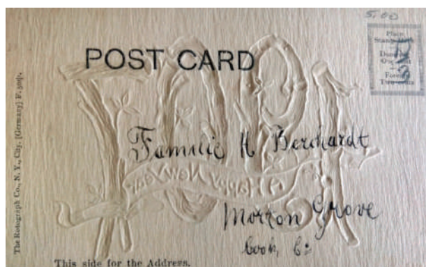
Рис. 3. Адресна сторона новорічної листівки 1907 року

Адресна сторона цієї вітальної листівки включає рамку для поштової марки, надпис, що зазначає місце написання адреси, та надпис, що зазначає виробника й тип листівки (рис. 3).