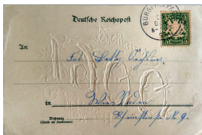
Рис. 16. Адресна сторона новорічної листівки 1900 року

Проблема полягає в тому, що з усіх листівок малодослідженою є історія становлення вітальної листівки, тобто актуальною є потреба дослідження саме вітальних листівок із приватних колекцій, проведення моніторингу наявності листівок на аукціонах. Потрібно докладніше розглянути художньо-образну складову частину, поліграфічно-технічну складову частину вітальної листівки, визначити естетичну й просвітницьку функції, докладніше вивчити художні особливості дизайну цих поштівок, що вивільнить достатньо потужний пласт важливої інформації, яку в майбутніх наукових працях зможуть використати студенти, аспіранти, музейні працівники та колекціонери. Таким чином, дослідження окресленої теми сприятиме значному розвитку мистецтва української графіки.