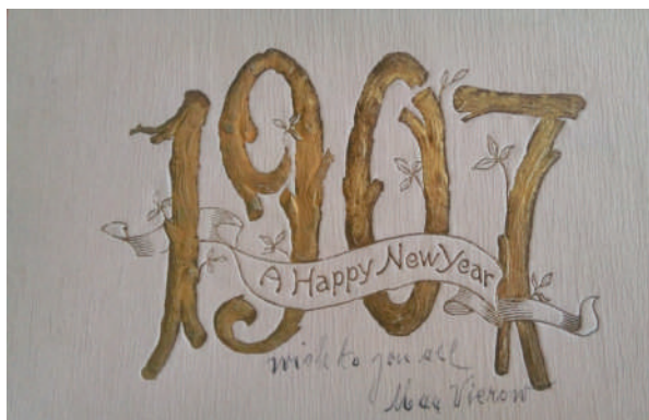
Рис. 1. Новорічна вітальна листівка 1907 року