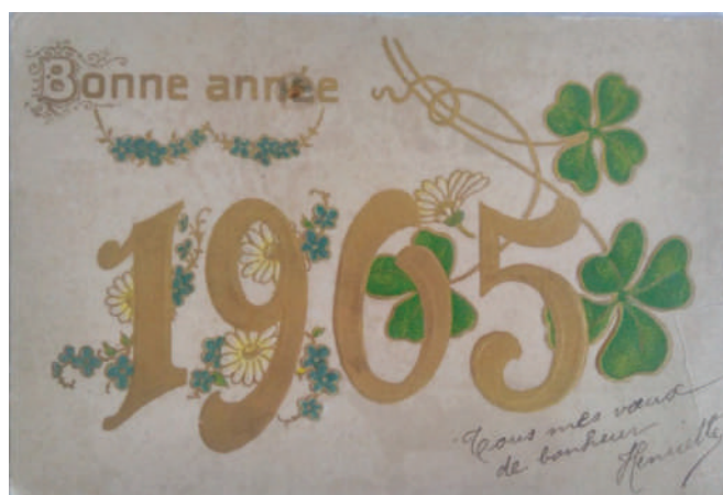
Рис. 7. Новорічна вітальна листівка 1905 року