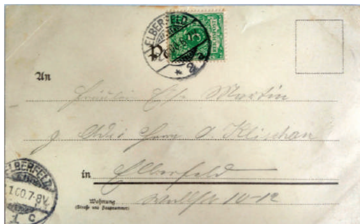
Рис. 15. Адресна сторона новорічної листівки 1900 року