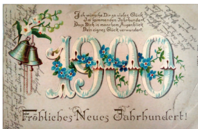
Рис. 9. Новорічна вітальна листівка 1900 року

З позиції символізму незабудка – це завжди символ любові, вірності, нагадування про тих, кого вже немає з нами поруч, але є в нашій пам'яті. Скромна квітка допомагає людині не забути про її коріння й витоки, про все, що по-справжньому цінне, але про що в повсякденних клопотах ми часто забуваємо (Квітка «любиме-не покинь»). Причому символіка незабудки у всіх народів однакова і незмінна багато століть. Важко