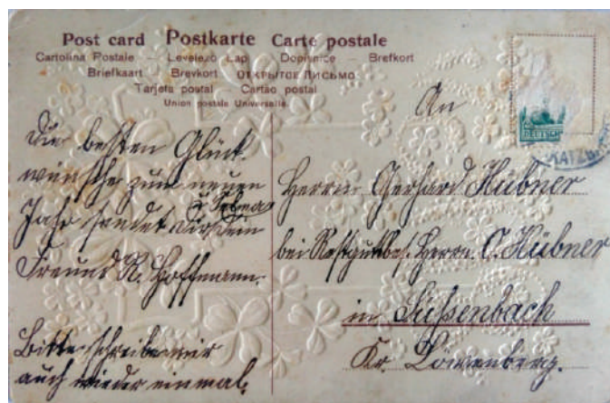
Рис. 11. Адресна сторона новорічної листівки 1908 року (Листівки з приватної колекції колекціонера П.В. Яковенка)

Це пов'язано з тим, що Німеччина та Австрія запровадили нововведення циркуляру у 1905 році. Проте адресна сторона листівки, зображеної на рис. 11, на відміну від адресної сторони листівки, зображеної на рис. 10, оформлена з дотриманням усіх нововведень, запроваджених циркуляром, та має вертикальну роздільну лінію. Обидві вітальні листівки на адресній стороні мають виконаний різними мовами напис «Відкритий лист» і, на жаль, не мають жодних позначок, які би вказували на виробника листівок.