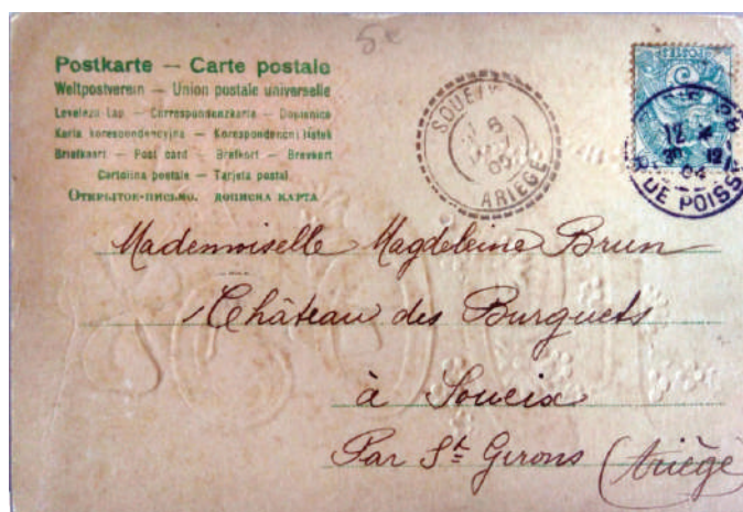
Рис. 13. Адресна сторона новорічної листівки 1905 року (Листівки з приватної колекції колекціонера П.В. Яковенка)