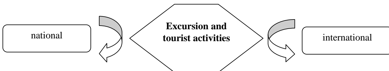
Fig.2. Educational path excursion and tourist activitie

Tour-tourism activities in the international context can not be limited only to specific activities, technologies and mechanisms, as it relates to the exchange system (see figure 2). In the context of a scientific study pedagogical phenomenon functions as a complex and multifaceted process intellectual movement, exchange of socio-cultural potential, resources and technologies (figure 2).