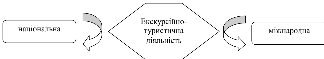
Рис.2. Геопросторові траєкторії екскурсійно-туристичної діяльності

Екскурсійно-туристичну діяльність у міжнародному контексті неможливо обмежити лише конкретними діями, технологіями і механізмами, оскільки вона пов'язана з системою обміну (див. рис.2). В науковому контексті досліджуваний педагогічний феномен функціонує як складний і багатоплановий процес інтелектуального руху, обміну суспільно-культурним потенціалом, ресурсами та технологіями (рис.2).