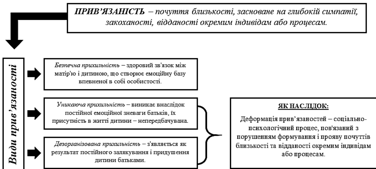
Рис. 2. Формування феномена «деформація прив’язаностей»