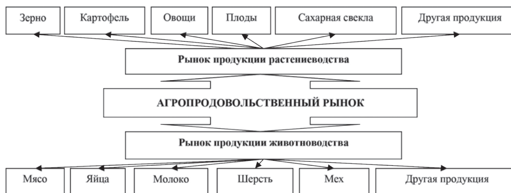
Рис. 4. Видовая и отраслевая структурная составляющая рынка мяса и мясопродуктов в общей системе агропродовольственного рынка

С учетом этих обстоятельств в большинстве стран с рыночной экономикой действуют развитые системы государственной регуляции, основными заданиями которых является поддержка стабильной экономической ситуации в сельском хозяйстве, стабилизация рыночной конъюнктуры и колебаний прибыльности в отрасли, предотвращение нежелательных миграционных процессов и тому подобное. Эти системы предусматривают поддержку продовольственной безопасности, помощь в адаптации к новым условиям, защиту внутреннего рынка и обеспечение конкурентоспособности национальных товаропроизводителей в международном делении труда (Кушнір, 2008).