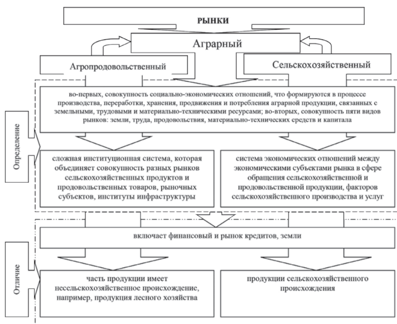
Рис. 2. Основные отличия между продовольственным, сельскохозяйственным и аграрным рынками