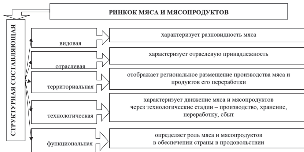
Рис. 3. Структурная составляющая рынка мяса и мясопродуктов

Эффективность функционирования рынка мяса и мясопродуктов в значительной степени характеризует уровень жизни населения, поскольку они являются продуктами повседневного спроса, поэтому исследуемый рынок в значительной степени определяет ключевые аспекты экономической стратегии развития аграрного сектора экономики Украины.