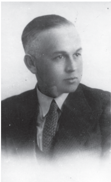
Рис. 1. Олександр Цинкаловський

Отож, як бачимо, поява такого вченого, як Олександр Цинкаловський, була не випадковою. Він став яскравим представником свого роду та епохи, став гідним репрезентантом своєї нації.