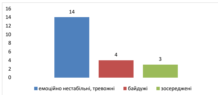
Рис. 3. Оцінка емоційного стану студентів

Виявлений рівень психологічної підготовки студентів до соціальної роботи на 2 курсі є низьким, що проявляється в недостатній психологічній готовності до майбутньої роботи, поверховість мотивів або їх відсутність взагалі, емоційна нестійкість, високий рівень тривожності, пов'язаної з виконанням професійних обов'язків, низька, фрагментарна усвідомленість щодо сфер і форм соціальної роботи, що свідчить про потребу в організації цілеспрямованої роботи в напрямку розвитку психологічної готовності майбутніх соціальних працівників, посилення підготовки до майбутньої професійної діяльності соціальних працівників (Голубенко, 2012: 164–168).